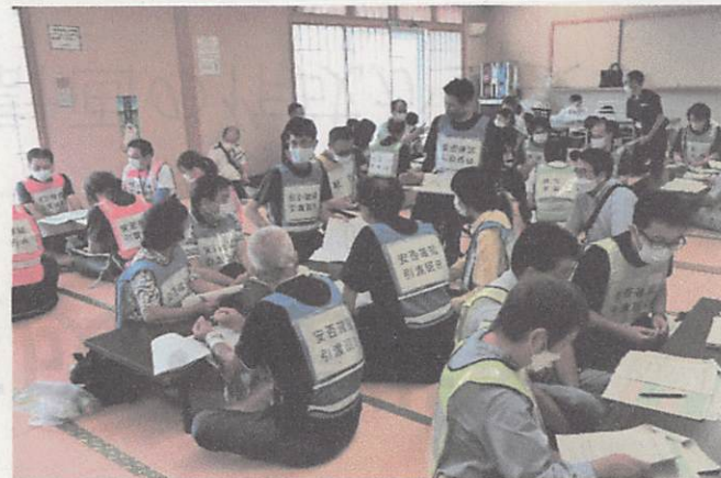
●6～7人の班に分かれ意見交換