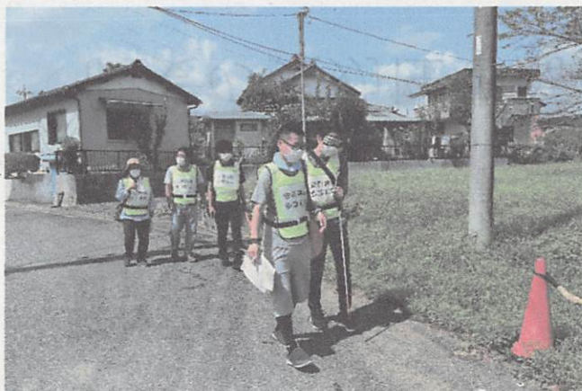
●要支援者宅から避難所への移動

今後、方法や規模を変えて他の地区でも要支援者に関する訓練を実施予定。横展開を目指す。