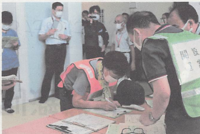
●避難所到着後の受付訓練