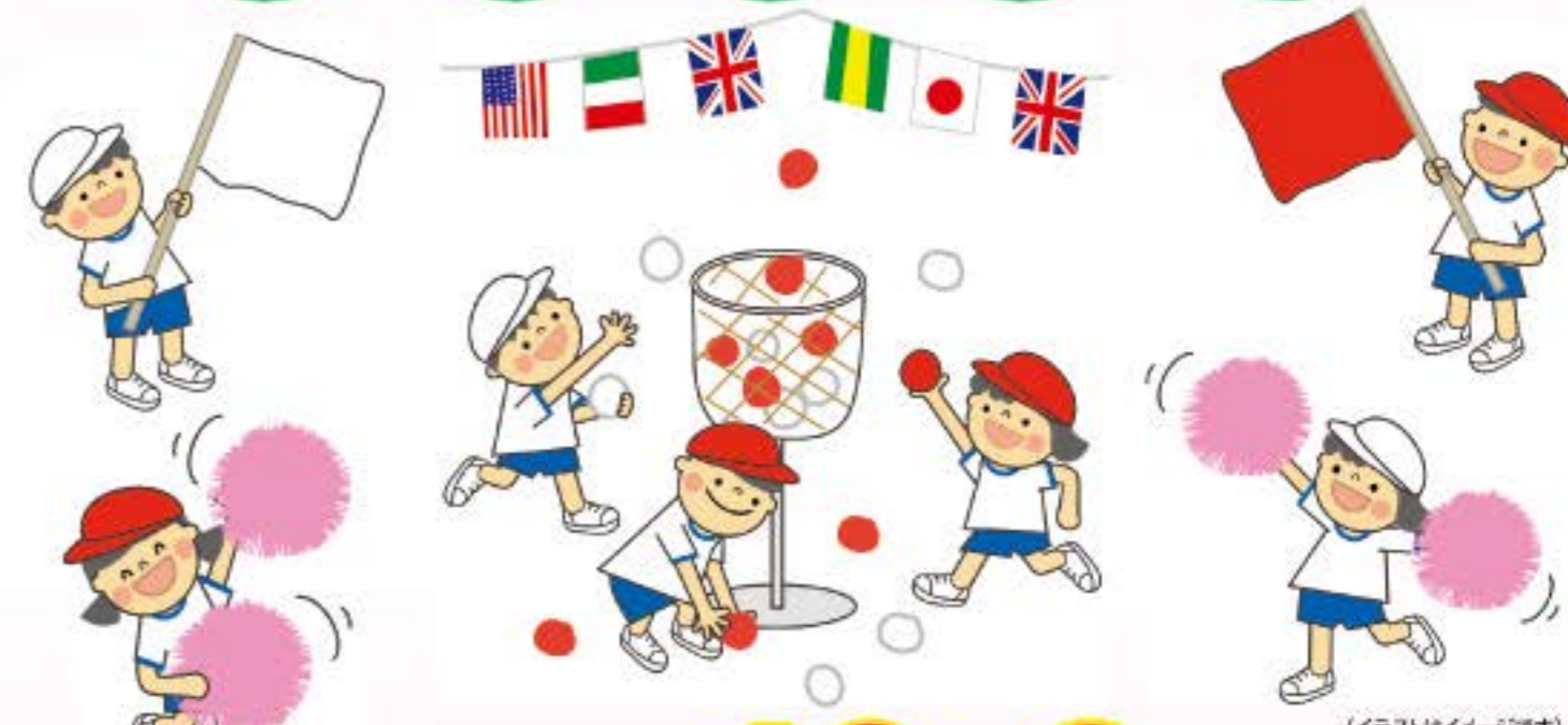
(イラストはイメージです)

日時：平成25年 10月6日(日) 受付：am8:30/開会：9:00/閉会：pm12:30 (雨天の場合は、体力測定のみ実施します)